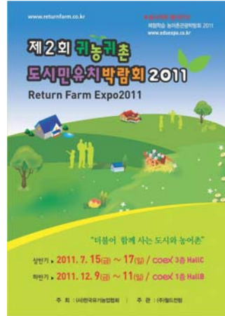
귀농귀촌 도시민유치박람회 Return Farm Expo 2011