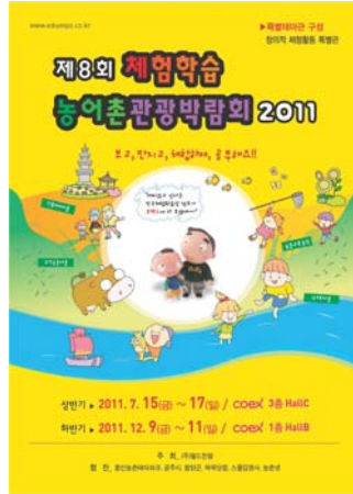
체험학습 농어촌관광박람회 Edutainment Expo 2011